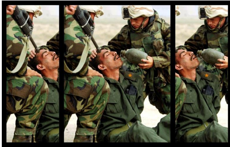
Sens d'une image