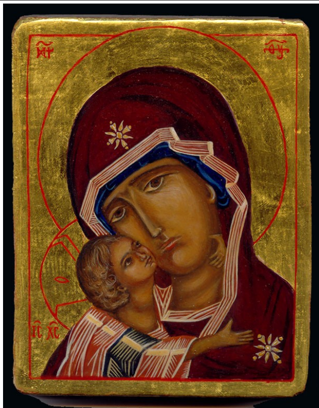
Icône de Vladimir, XIIe siècle.

Question : comment ces deux empires chrétiens se différencient-ils sur les plans religieux et culturel?