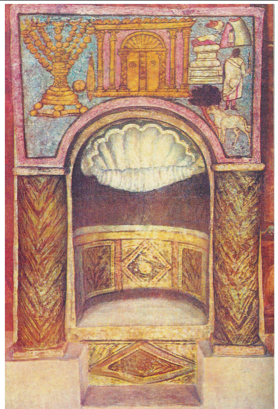
Niche de l'arche sainte de la synagogue de Doura Europos (Syrie)

Après la destruction du temple de Jérusalem et l'expulsion des Juifs de Judée, ceux-ci se dispersent tout autour de la Méditerranée et constituent la diaspora . Les synagogues , nouveaux lieux de culte (ex. : Doura Europos en Syrie, II-III e siècle), se multiplient. Les juifs s'y réunissent le samedi, jour de shabbat et lisent la Torah . Les règles de vie et les pratiques religieuses sont précisées dans le Talmud . Les chefs religieux de ces communautés sont les rabbins .