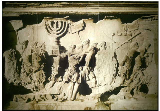
Détail de l'Arc de Titus. Pillage du second Temple de Jérusalem par les Romains (Forum de Rome, I e S.)