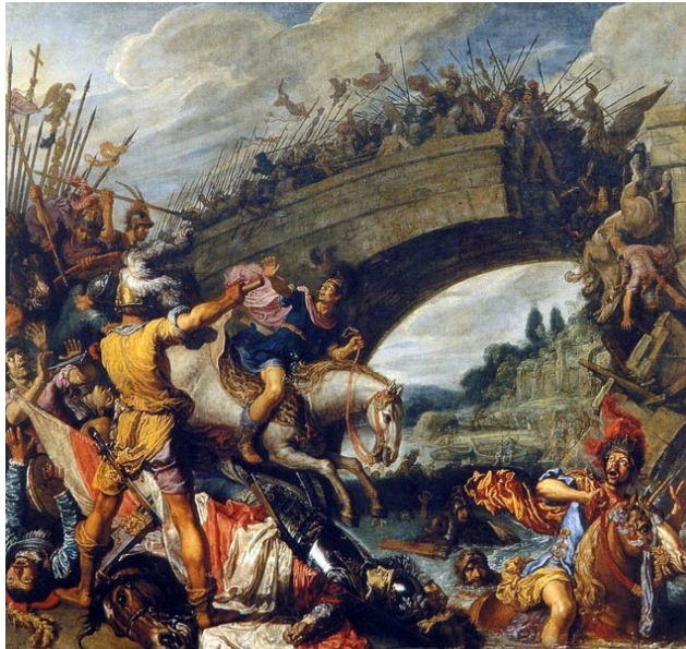
Pieter Lastman, La Bataille du pont Milvius , 1613