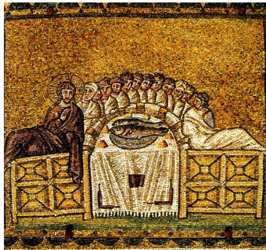
La cène, mosaïque du VIe siècle, basilique de St Apollinaire de Ravenne, Italie

Les chrétiens s'organisent dès le IIe siècle. C'est le début de l' Eglise . Les communautés obéissent à un évêque secondé par un prêtre . Les lieux de culte se multiplient et reprennent le plan des édifices civils romains, les basiliques . Les conciles précisent les croyances et les rituels. Le christianisme se diffuse plus rapidement dans les villes que dans les campagnes.