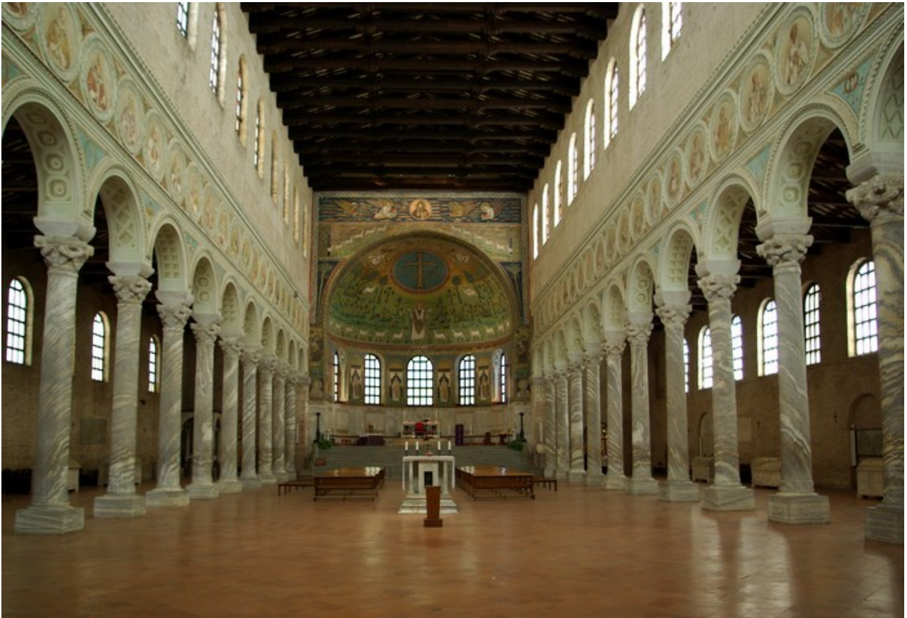
Basilique Saint-Apollinaire-in-Class, VIe siècle, Ravenne, Italie.

Question : comment l'Empire romain est-il devenu chrétien?