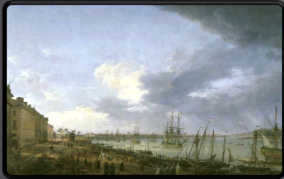
Joseph Vernet 1758