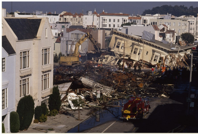
Le tremblement de terre du 17 octobre 1989, à Marina.

Questions : quelles contraintes pèsent sur l'agglomération? Quels aménagements pour y faire face?