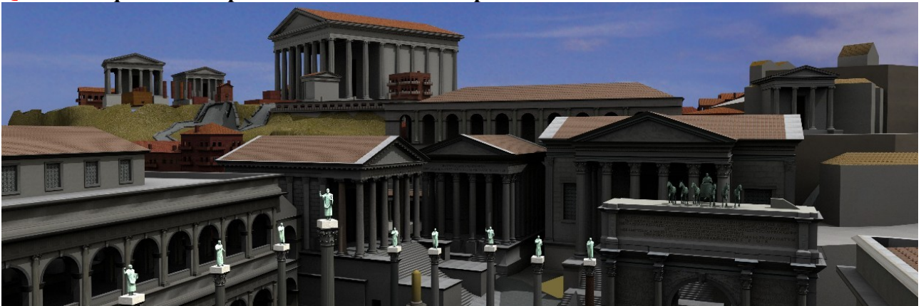
Reconstitution du forum et du Capitole dans la Rome antique.

Question : quelle est la place de Rome dans l'Empire?