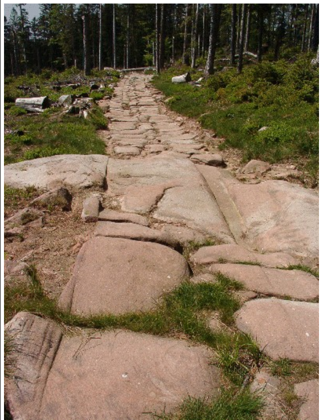
Voie romaine près de Raon-lès-Leau , Lorraine.

L'Empire fournit de nombreuses ressources à la capitale (ex. : blé d'Égypte, tissus d'Orient, esclaves d'Afrique, tribut). Celles-ci circulent par voies maritime et terrestre. Car Rome est peuplée d'un million d'habitants qu'il faut approvisionner en permanence.