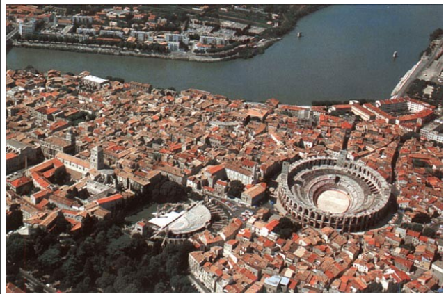
L'amphithéâtre à Arles.