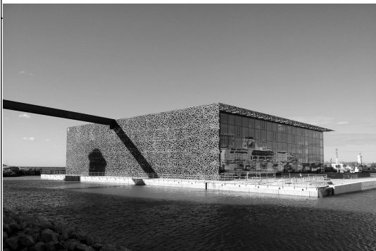
Architecte : Rudy Ricciotti / année 2013– MUCEM - Marseille

POINTS COMMUNS (matériaux / formes / couleurs / idées...)